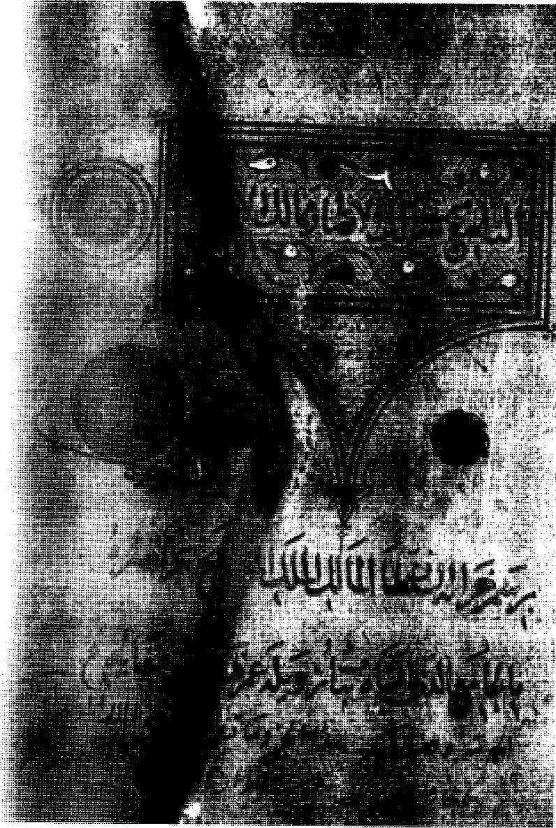
صفحة العنوان - مخطوطة أحمد الثالث - طوبقيو سراي - استانبول رقم ٢٧٩٧